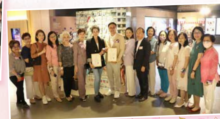
各執行委員與贊助人合照