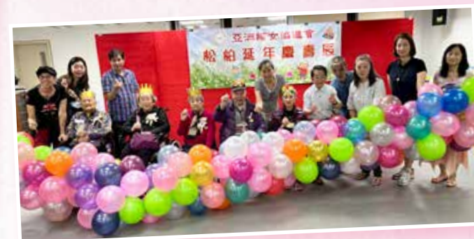
松柏延年慶壽辰：執委員及表演嘉賓開心與院友 慶祝壽辰