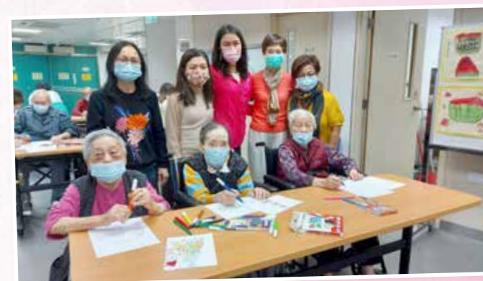
香港扶輪社與院友合照