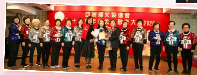
致送紀念品大合照