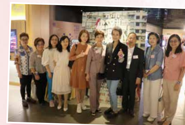
「我愛你」慈善電影會 2023