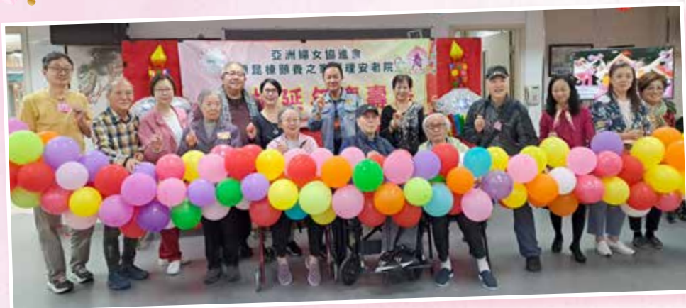
松柏延年慶壽辰： 執委員、表演嘉賓與壽星及 家人進行鳴放禮炮儀式