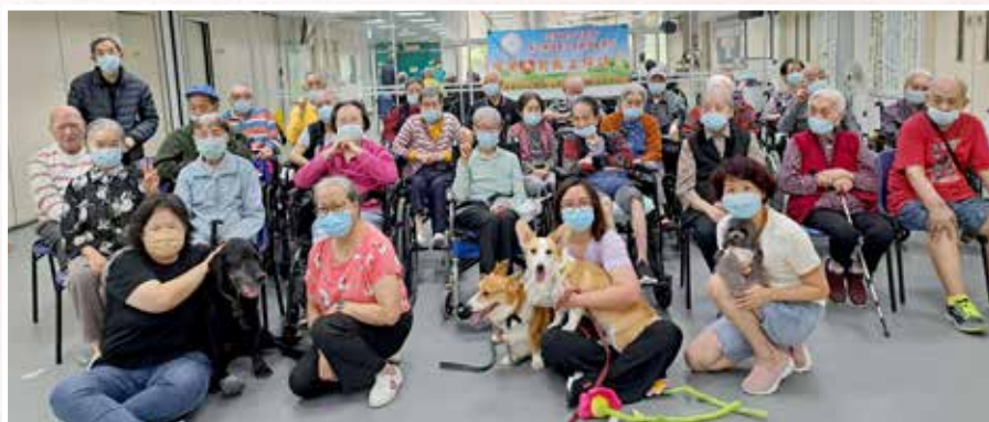
愛心狗義工探訪：與院友共渡歡樂下午