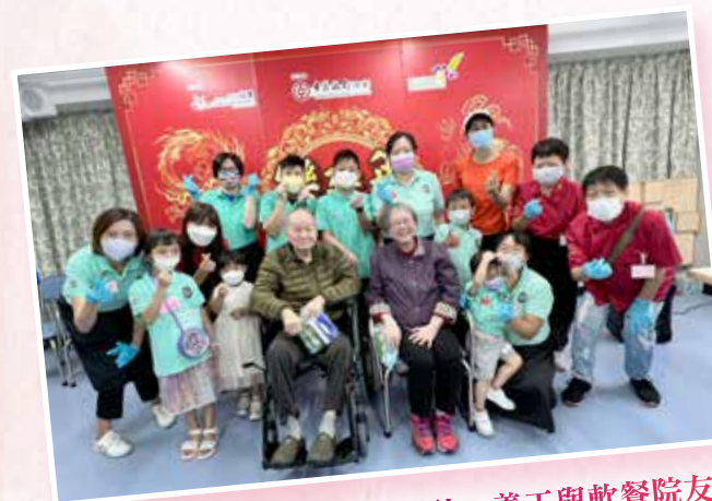
香港婦聯龍鳳茶樓愛心探訪：義工與軟餐院友 一同分享茶聚的樂趣