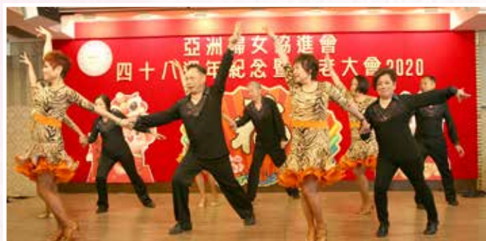
何梁潔庭活動中心社交舞班表演