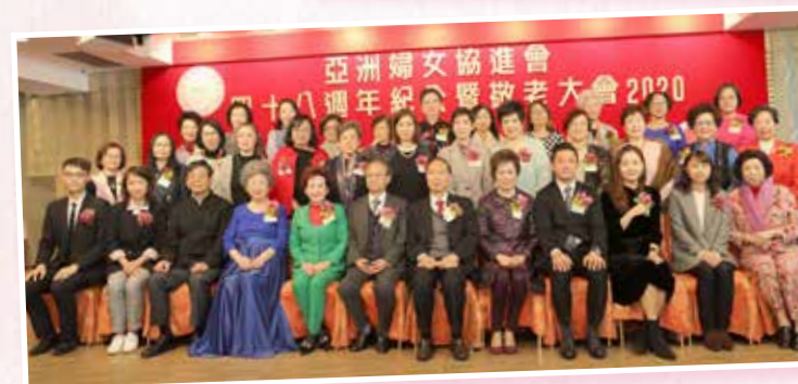
執委與禮嘉賓大合照