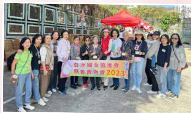
2023 年 11 月 25-26 日賣物會執行委員與委員出錢出力支持活動