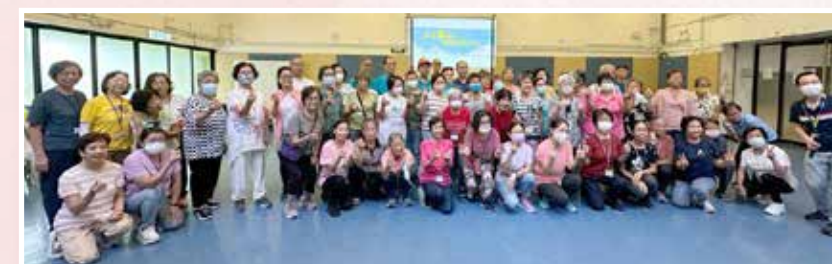
「油尖「搜」望相助計劃 2023: 義工訓練日營」