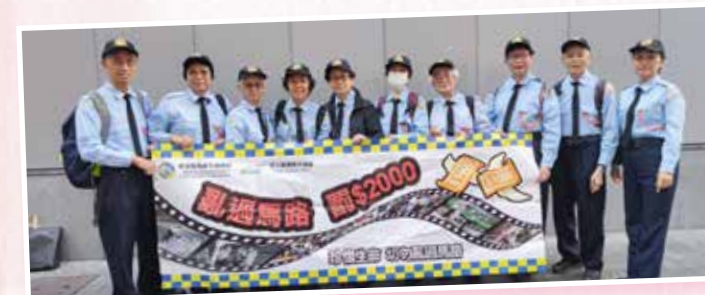
交通安全隊協助九龍交通部派傳單