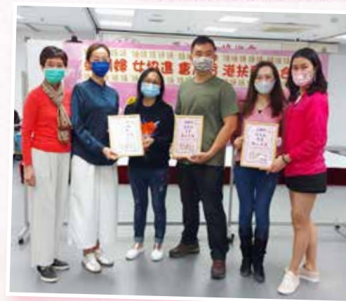
香港扶輪社接受頒發感謝狀