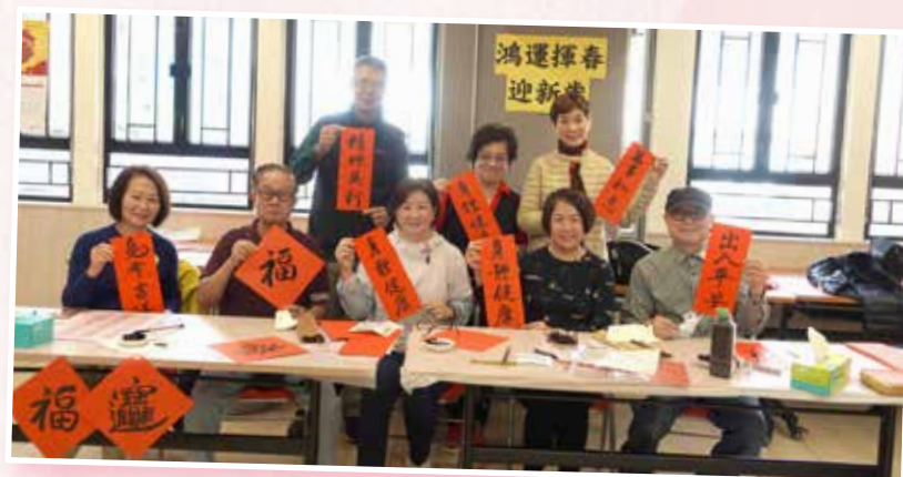
2023 何梁潔庭活動中心書法班學員 寫揮春送贈會員