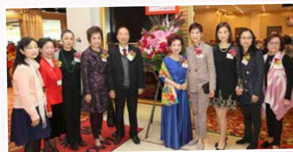
執委與主禮嘉賓合照