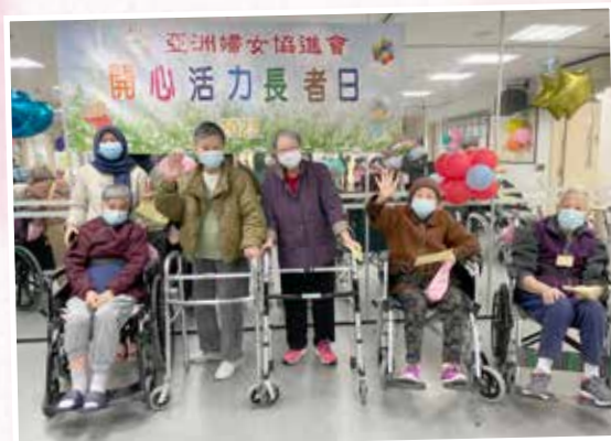
開心活力長者日：院友開心參與長者日慶祝活動