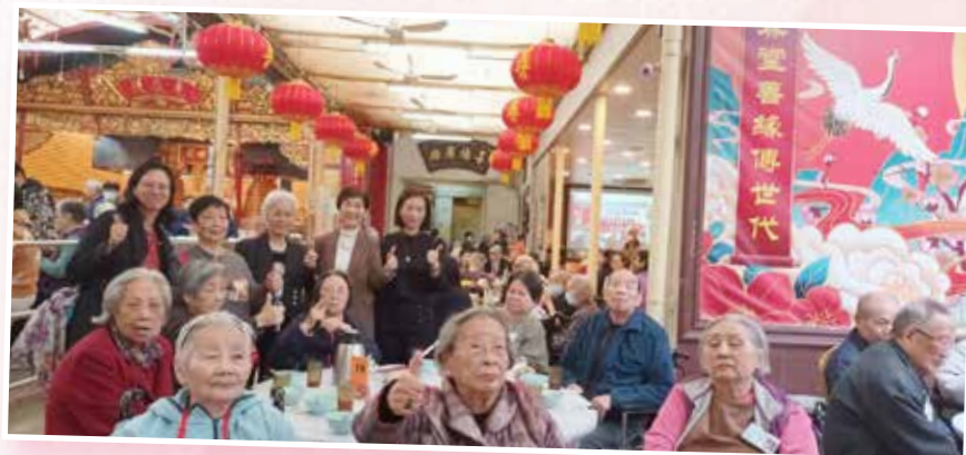
健康生活素食遊：省善真堂千人齋宴