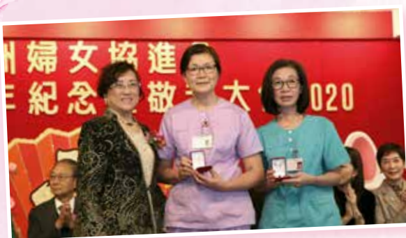
頒發二十年職員長期服務獎