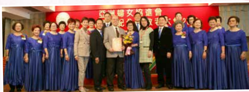
何梁潔庭活動中心歌唱班及學員接受致送紀念品