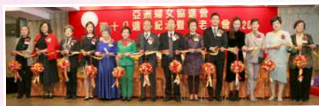
主席團及會長陪同主禮嘉賓及大會贊助人進行剪綵儀式