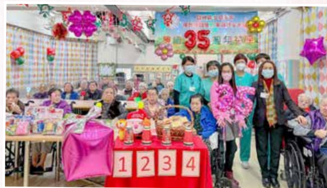
懷緬三十五週年茶座：細說話當年