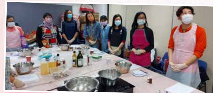
手工番梘活動花絮