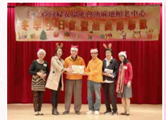
冬季生日會暨聖誕節聯歡