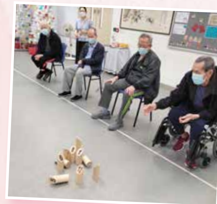
芬蘭木棋體驗班：院友由義工協 助下學習芬蘭木棋的玩法