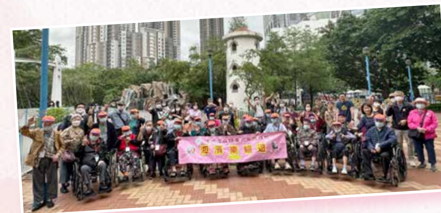
春季旅行：海濱樂暢遊