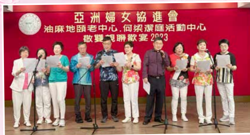
敬雙親聯歡宴 2023 聲樂悠揚