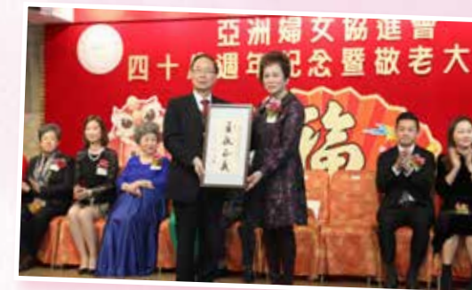
執委與主禮嘉賓合照