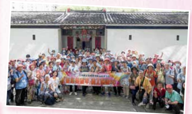
「愛心樂耆年」義工酬謝 2023