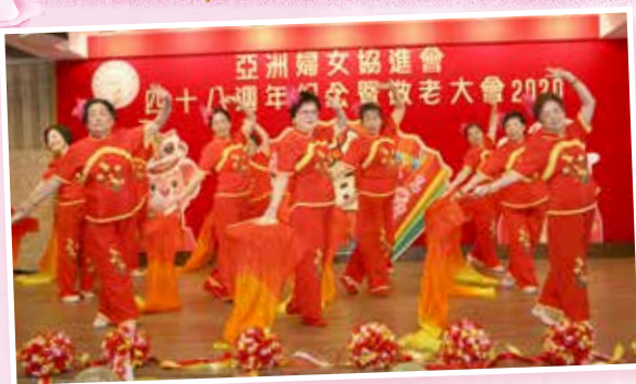
本會油麻地頤老中心太極活力球班學員羽扇舞表演