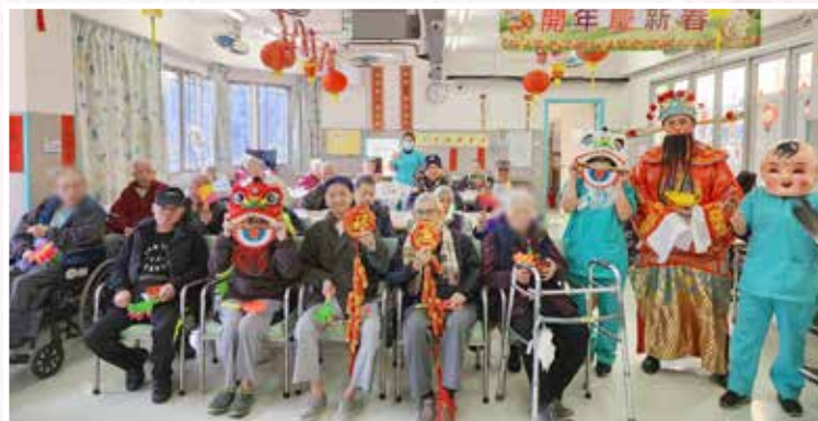
開年慶新春：財神來到賀