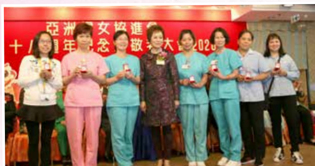
頒發五年職員長期服務獎