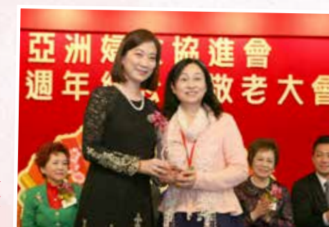
鍾美詩副主席致送十年執委長期服務獎