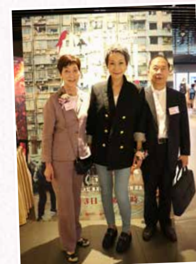
執行委員會主席、鍾律師 與葉童合照