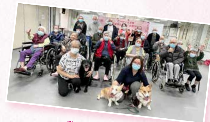
動物醫生愛心探訪