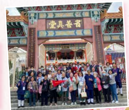
健康生活素食遊：省善真堂千人齋宴