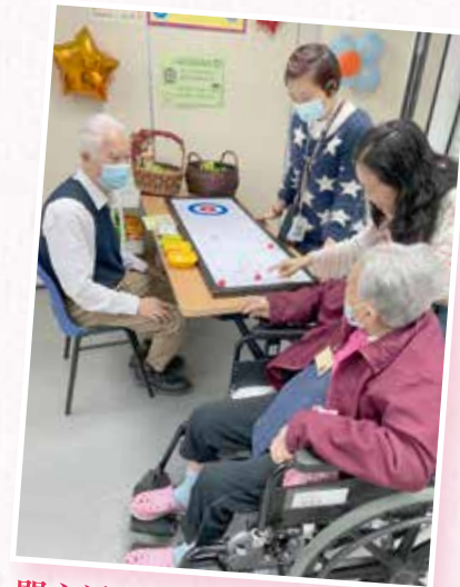
開心活力長者日：執委員與院友嘗試參與桌上冰壺活動