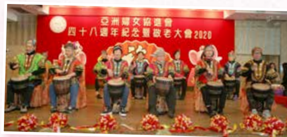
本會油麻地頤老中心繽紛非洲鼓班學員表演