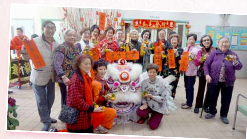
三院院友代表送贈新年揮春與主席團及各執委員