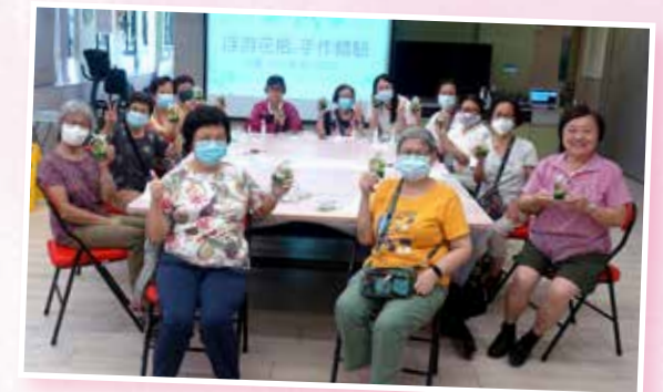
浮遊花瓶手作體驗