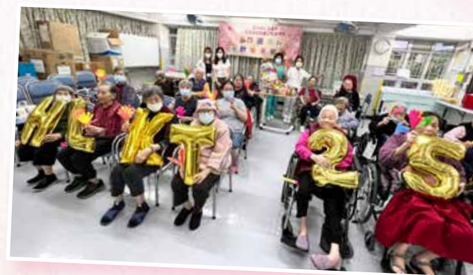
25週年歡樂茶聚：與院友共同慶祝院舍25週年， 細說開心經歷