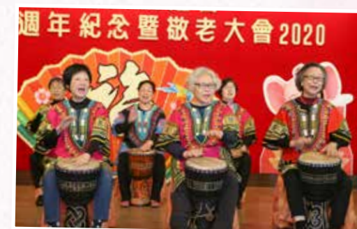
本會油麻地頤老中心繽紛非洲鼓班學員表演