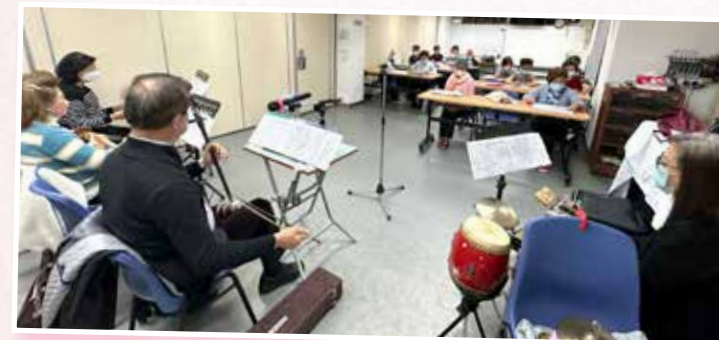
2023 年粵曲班譚老師、樂師們與同學歡唱粵曲