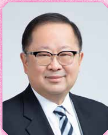
安老事務委員會主席李國棟