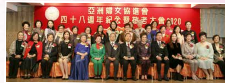
主席團及會長陪同主禮嘉賓及大會贊助人進行剪綵儀式