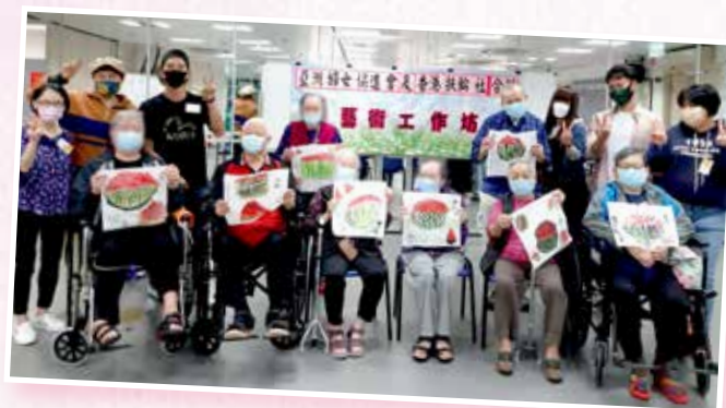
香港扶輪社合辦藝術工作坊