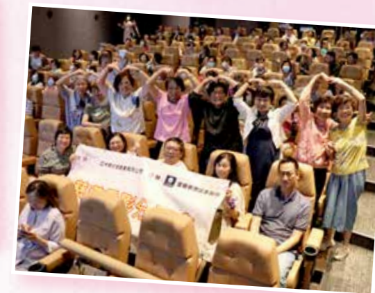
戲院內油麻地中心會員與執行委員合照