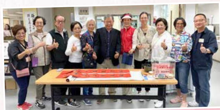
2023 賣物會書法班老師、同學與主席合照