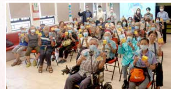
煤氣安全環保講座