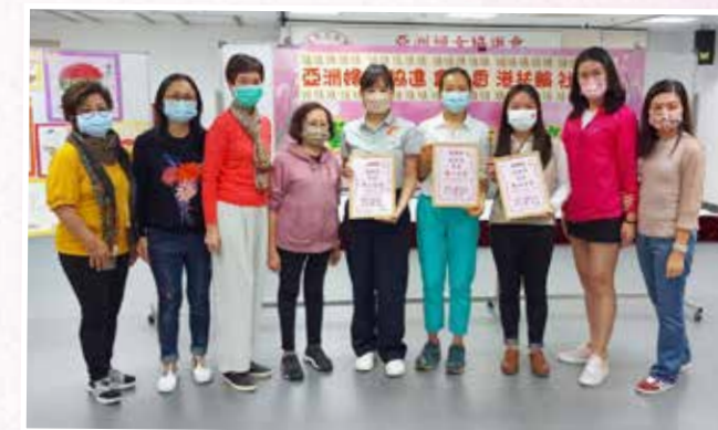
香港扶輪社與執行委員合照