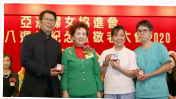
頒發十年職員長期服務獎